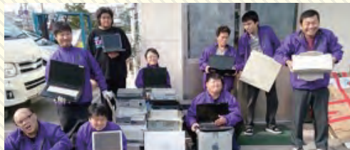
仲間と一緒に働く喜びを共有

『障がいを乗り越えて国と地域に貢献』小型家電のリサイクルにより賃金UPを実現しました。