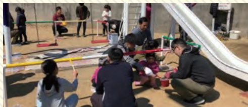
子ども達と一緒に楽しく地域貢献

関西こども建設王国や公園遊具の塗装、落書き消しなど税金に頼らないイベントを企画・実施しています。