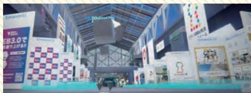
仮想空間に作られた堺の魅力発信ブース

新技術を行政サービス向上に繋げるために一般社団法人を設立。自主財源で様々な企画に挑戦しています。